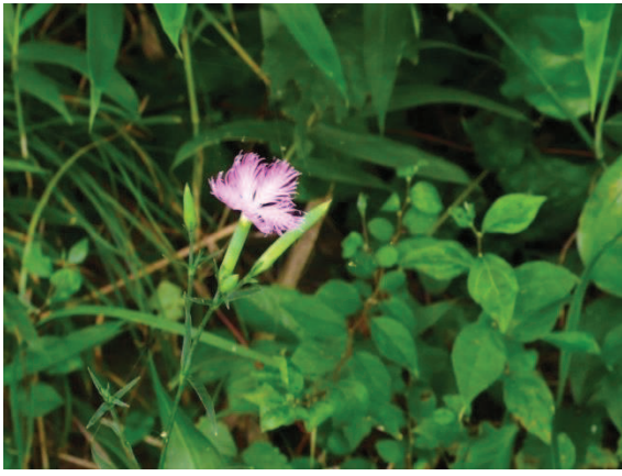
④一輪木陰に咲くナデシコは真夏なのに秋を思わせる。